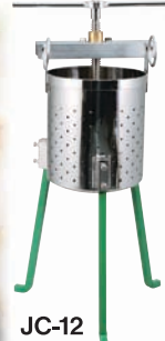
JC-12 Gyoza Vege Strainer