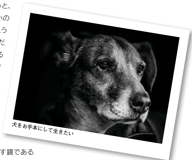
犬をお手本にして生きたい

犬の考え方は、すべてが白か黒。行動も白か黒。グレーゾーンのない、直球勝負で生きる犬の世界は私には鑑です。そして、生きる姿勢の鑑である犬との暮らしは、私にとっては何ものにも代えることのできない貴重な財産です。