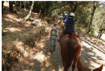
乗馬は初めてという子供も平気

サンタクルーズは洒落たビーチタウンで、マリオットホテルの個性的なオートグラフコレクションであるスタイリッシュな「ホテル・パラドックス」もある。ここからシリコンバレーまでは、北に1時間ほど。IT企業の拠点のイメージがあるエリアだが自然も豊かで、1974年からやっている「シャパラル・アット・ウッドサイド」で初心者でも乗馬ができるし、もちろんサンノゼでスタンフォード大学に寄ったり、いかにもこの土地らしい「コンピューター・ヒストリー・ミュージアム」でアップルコンピューターの1号機に目を見張ったりなんてことも。ビジネスエリート客のゲストも多いサンノゼでさすがの客室や施設の素晴らしさを誇る