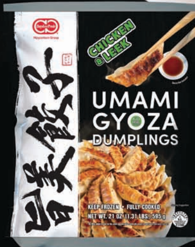
CHICKEN & LEEK