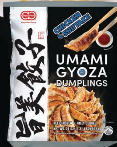
CHICKEN & SHIITAKE

デイリーフーズは日本ハム株式会社の米国法人です。食品加工品の製造および販売を主な業務内容とする当社は、1985年より高品質な加工食品を小売市場向けにご提供しています。