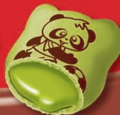
Matcha Green Tea