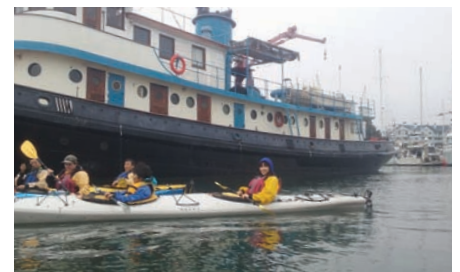
オールの使い方を習ったらすぐ海へ

また、ウォーターアクティビティが好みという人は、サンフランシスコから40分ほどのハーフムーンベイにある「ハーフムーンベイ・カヤック・カンパニー」でカヤッキングに臨めば、海鳥やアシカたちが寄ってくる。近くにはおいしい地ビールが楽しめる「ハーフムーンベイ・ブリューイング・カンパニー」も。海に山に選択肢の広いサンフランシスコ郊外の旅である。