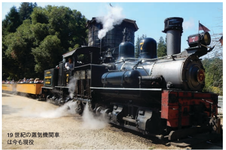
19世紀の蒸気機関車は今も現役