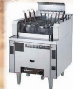
NSU6-60H w/Auto Lifter