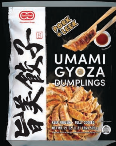
PORK & LEEK