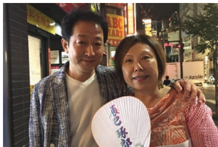
日本ワインを応援する会の副会長と

とはいえ、現場でブドウ栽培やワイン造りに関わっている方々の苦労は、続いている。まず、ワイン用ブドウの栽培者が育っていない。皮が薄く、タネなしで、実が大きいアメリカ産の生食用ブドウなどでは、