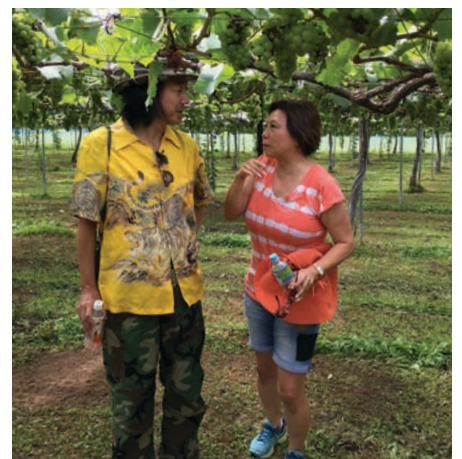
ナババレーで醸造を経験し、日本で活躍するワインメイカー

今では筆者も、日本人が日本のワインを応援したいという心情は理解できる。なぜなら、ワイン造りにまったく向かない高温多湿、大雨の風土にも関わらず、本当に熱心にブドウやワイン造りを研究し、励む姿を見てきたからだ。とはいえ、ビジネスの視点で見た場合、日本だけで通じる「甘え」が、生産者にも消費者にもある。要は「身内びいき」ということで、国内だけで通じて、海外の厳しい「自由競争」市場では、生き抜いていけないということ。今の日本ワインの質と値段では、まだまだ海外では通用しない。そういうアドバイスを会う人ごとにしてきた。と同時に、日本ワインの質をうんと上げて、来日する外国人に胸を張って振る舞える酒に成長させてほしい。そして、その中の一部でも、海外進出に値するブランドができたなら……と願ってやまない。