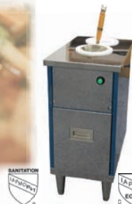
JRT-2000 Noodle Vacuum Dryer